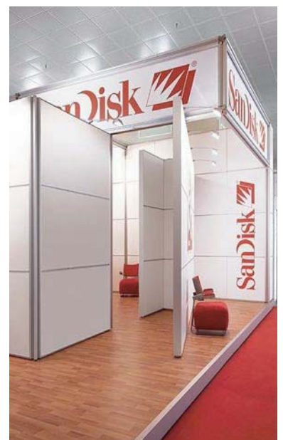
Edles hochwertiges Design mit System